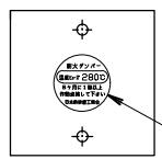
日本防排煙工業会ラベル (280°C表示)